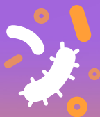
Sistema inmunitario debilitado tras otras enfermedades